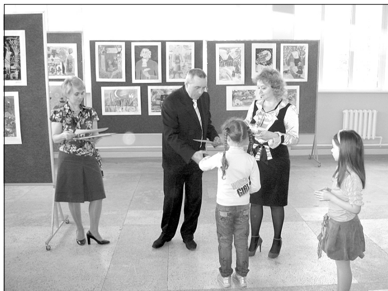
Фото: На открытии выставки «Русский Север»