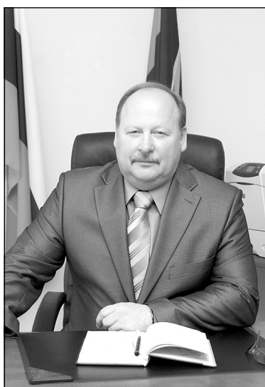
глава администрации Мирного О.Л. Смирнов

Дорогие жители Мирного, сегодня хочется пожелать вам, вашим семьям крепкого здоровья, счастья и благополучия, уверенности в завтрашнем дне. Крепкого вам здоровья и хорошего весеннего настроения!