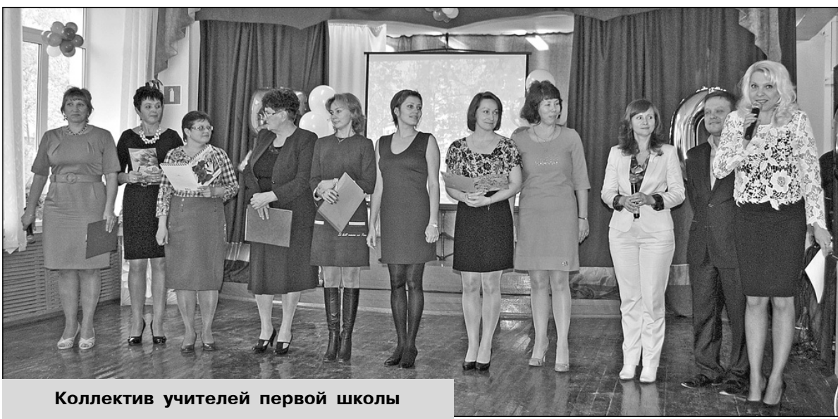
Коллектив учителей первой школы