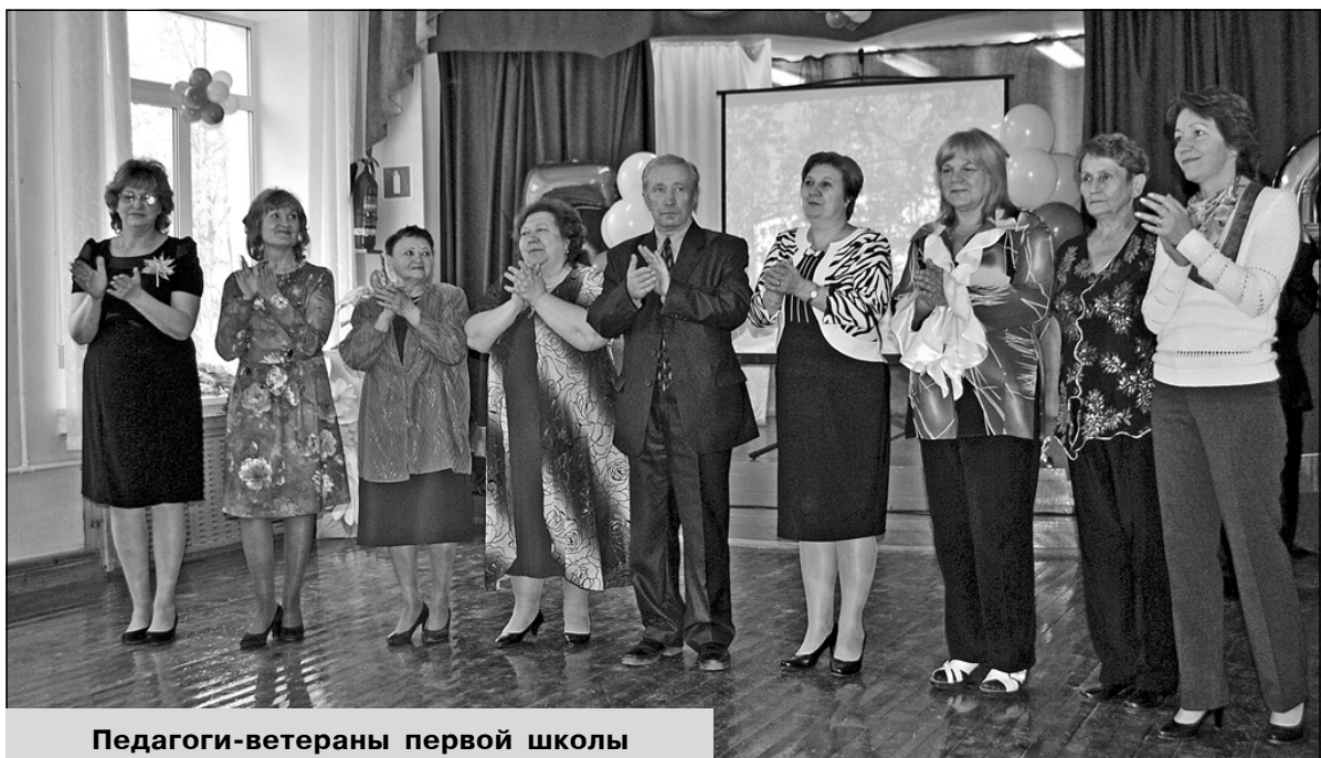
Педагоги-ветераны первой школы