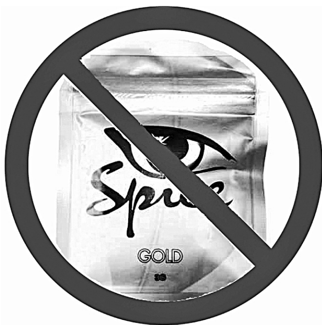
■ Статья подготовлена специалистами отделения войсковой части 13991 по работе с личным составом

Если речь идет о зеленой лужайке, газоне, бескрайних полях, то, безусловно, вид травяного покрытия приятен нашему глазу, и яркие цветочки среди травинок-былинок милы не только любителям природы, но и самым отъявленным урбанистам. А вот если возникает серьёзный разговор о растениях, которые входят в состав курительных смесей - спайсов, тут уж не до положительных эмоций, а впору кричать во весь голос: "Опасно! Опасно! Опасно!"