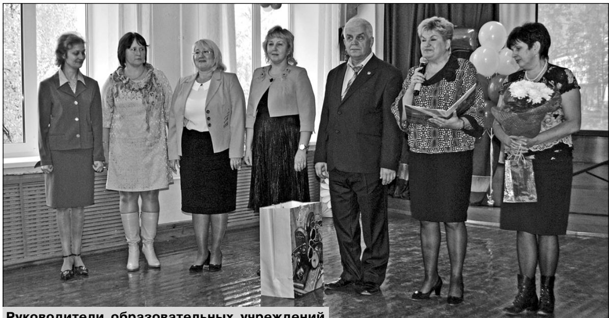
Руководители образовательных учреждений поздравляют школу-юбилера