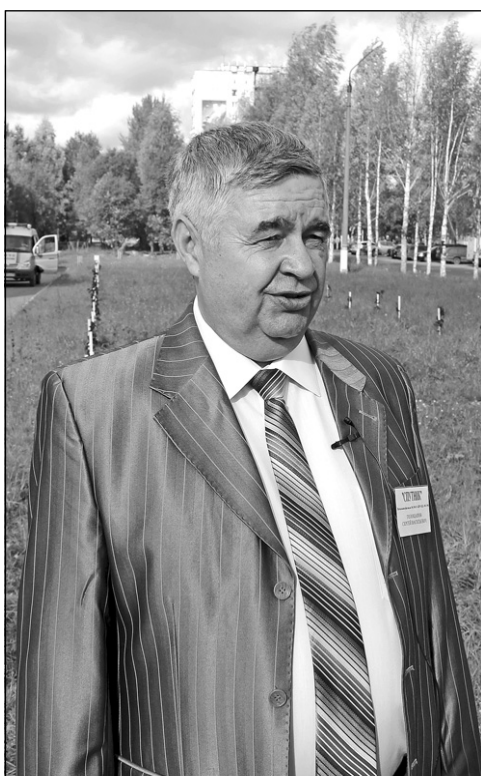
■ Беседовала Майга ШИПОВА