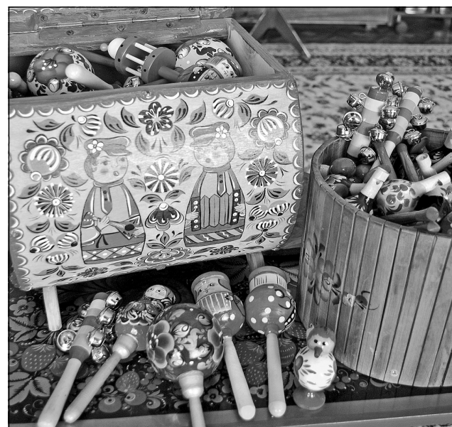
В "Солнышке" аккордеон - тоже вещь незаменимая. Ведь немало мероприятий, особенно народных праздники, проводятся на улице. Да и в зале народная музыка звучит не редко. Детям очень нравится, особенно если им дать возможность внести свою лепту шумовыми инструментами: трещетками, погремушками, бубенцами, свистульками, которые хранятся вот в таких чудесных ларцах и коробках