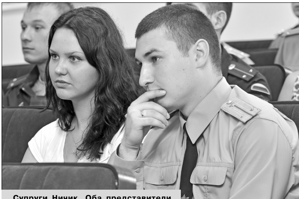
Супруги Ничик. Оба представители одной из самых благородных профессий - врачи