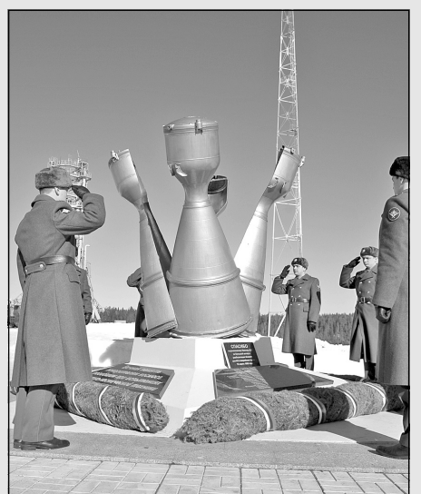
Площадка №43. Минута молчания у памятника покорителям космоса, погибшим при испытании ракетно-космической техники