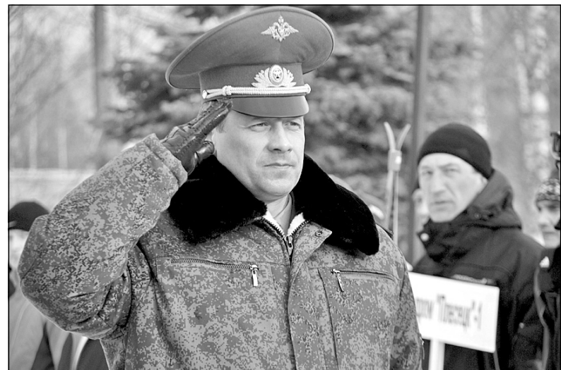
На фото: Начальник 1 ГИК генерал-майор Олег Майданович приветствует спортсменов