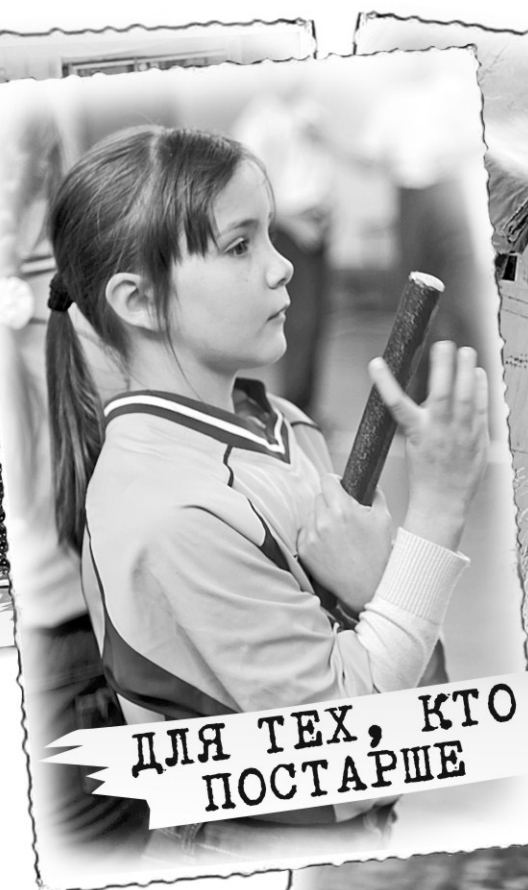
ДЛЯ ТЕХ, КТО ПОСТАРШЕ