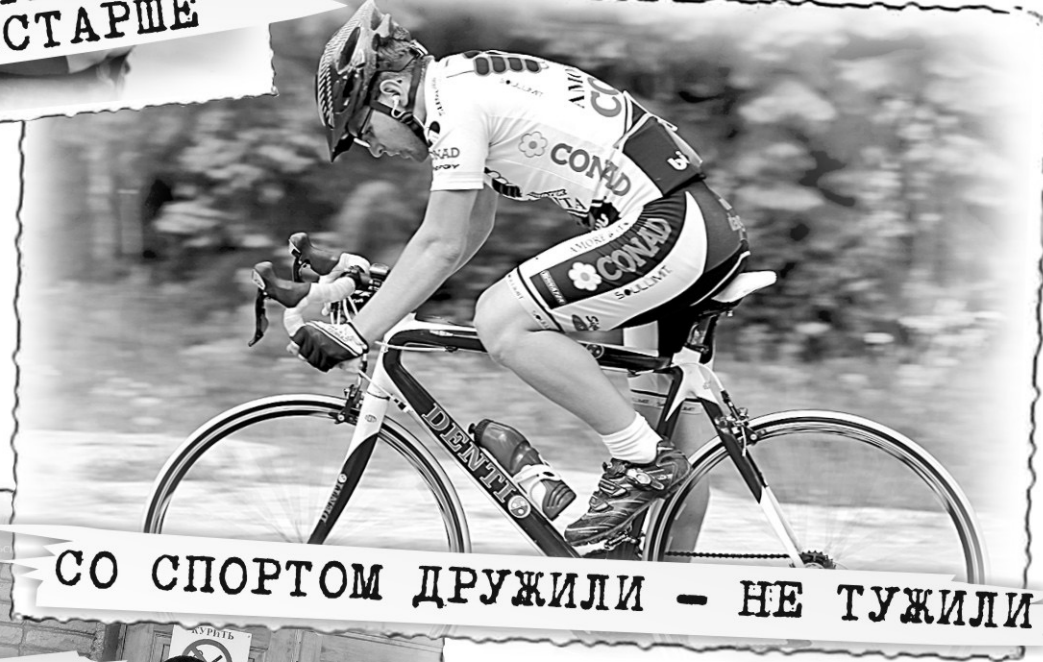
СО СПОРТОМ ДРУЖИЛИ - НЕ ТУЖИЛИ