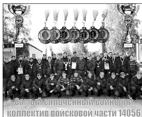
Самый сплоченный воинский коллектив войсковой части 14056

И опять о подконкурсах. В 5 баллов оценивалась победа в подконкурсе на исполнение строевой песни. Также в 5 баллов оценивались стихотворения