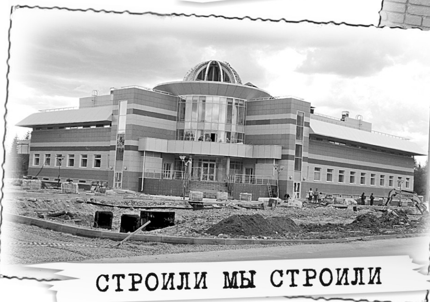
СТРОИЛИ МЫ СТРОИЛИ