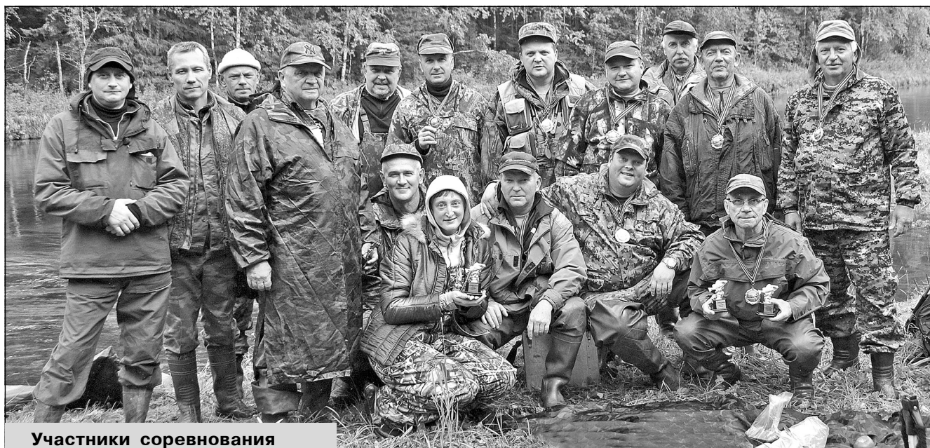
Участники соревнования Емца-2014