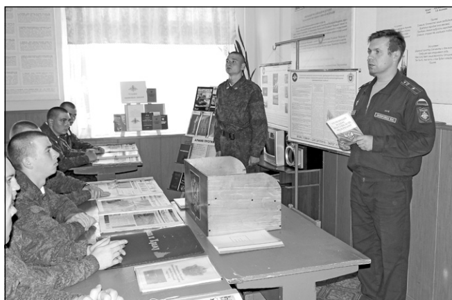
■ Специалисты отделения по работе с личным составом войсковой части 08324

В Учебном центре Войск ВКО, дислоцируемом на космодроме "Плесецк", проведение такого Месячника совпало с периодом обучения курсантов, призванных в Вооруженные Силы Российской Федерации в мае - июле 2014 года.