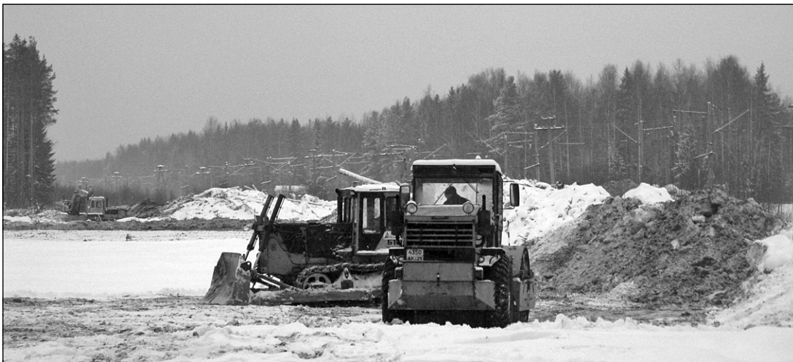
На фото: работы на объекте «Строительство автомобильного путепровода ...»

Руководители города убедились: на объекте в две смены - с 7 утра до 19 вечера без выходных и праздничных дней - вахтовым методом ежедневно трудится по 17 человек. Такой напряженный ритм определен необходимостью наверстать отставание от ранее ус-