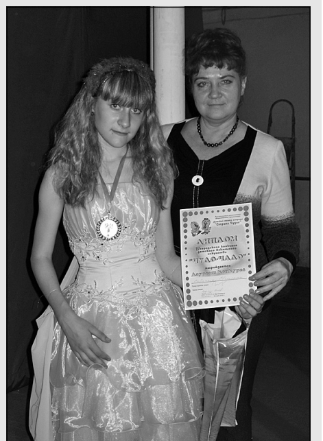
«Хорошее настроение» покоряет Европу