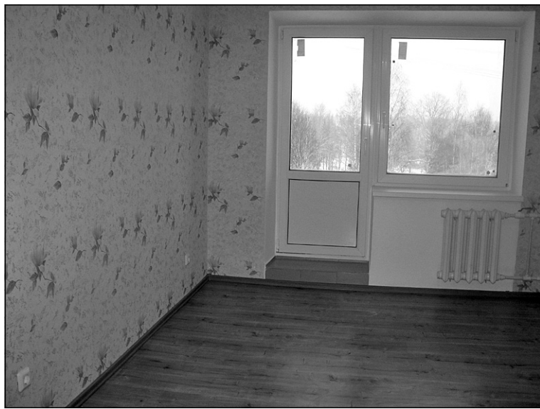
На фото: готовая квартира