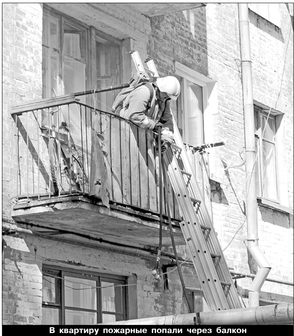
В квартиру пожарные попали через балкон

Отдел ГПН СУ ФПС № 18 МЧС России в очередной раз призывает родителей обращать внимание на обучение своих детей требованиям пожарной безопасности с ранних лет, рассказывать им о том, что нельзя делать при пожаре, как позвать на помощь, как позвонить в пожарную охрану, медицинскую службу и т.д. Необходимо личным примером показывать, как поступать в определенных ситуациях с огнем. Постарайтесь не оставлять дома в легкодоступных и видных местах спички, а также детей без присмотра.