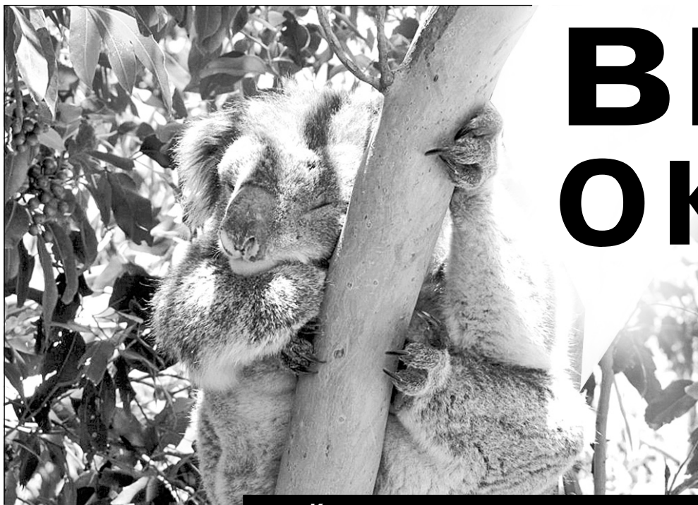
Коалы - милые и равнодушные