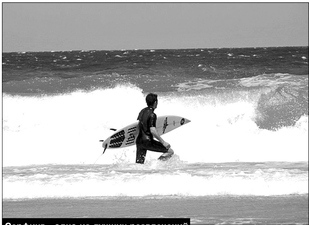
Серфинг - одно из лучших развлечений на океане

Полезно для органов дыхания, я думаю. Стоило вытянуть руку, даже если в ней ничего, разнообразные попугаи слетались со всего парка.