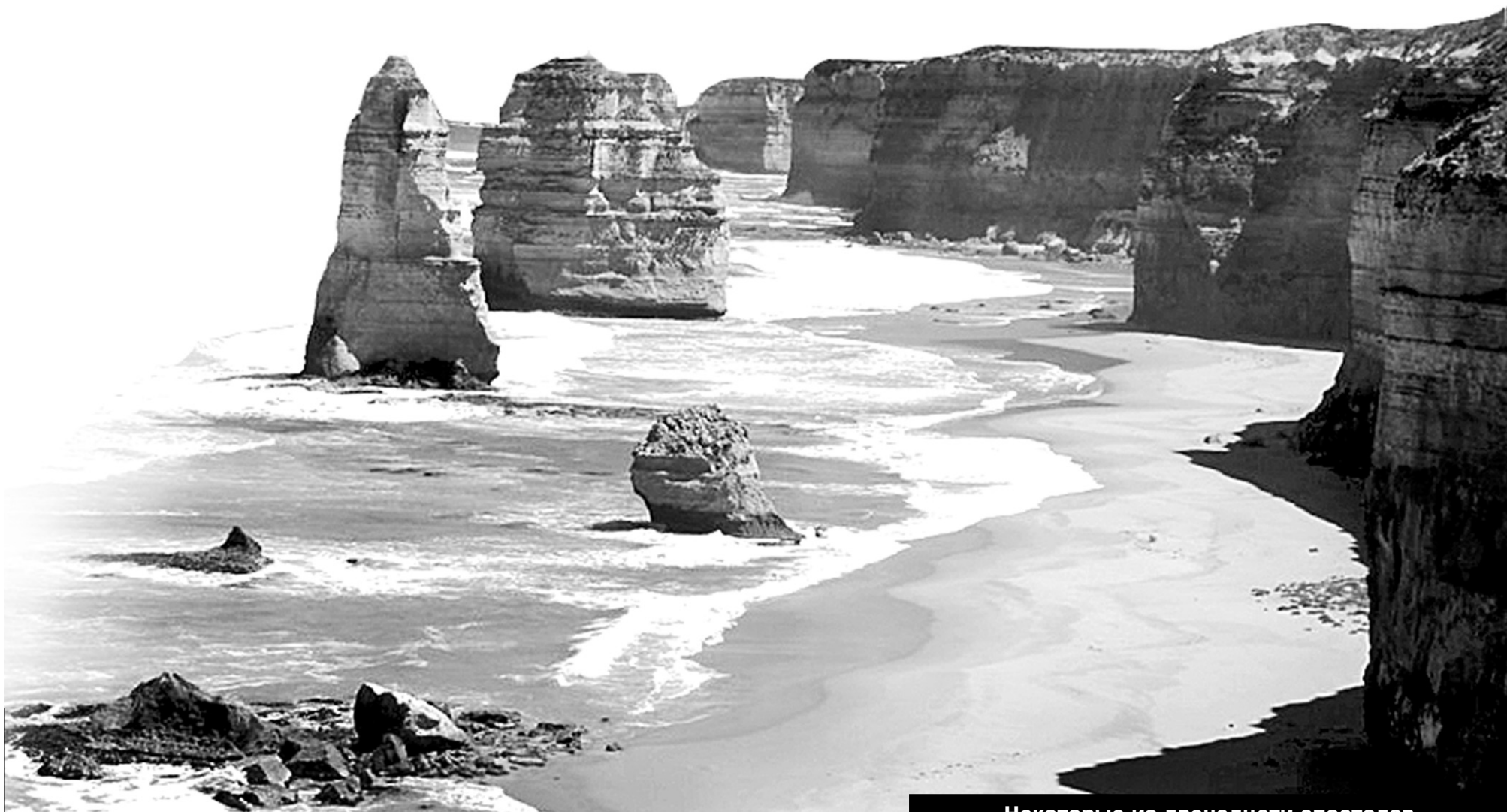
Некоторые из двенадцати апостолов

Первыми попались коалы, они мирно храпели на деревьях и не обращали на меня совершенно никакого внимания. Если честно, из 7-10 коал ни одна так и не пошевелилась. Коалы - это эндемик Австралии, то есть вид, не встречающийся нигде более в мире. Эти живущие на ветках эвкалиптов зверюги некогда плотно заселяли почти все леса по побережью Австралии, но оказались под угрозой исчезновения. Вырубка лесов и охота сократили популяцию до опасного минимума. Весьма впечатлил очень сильный запах эвкалиптовых лесов.