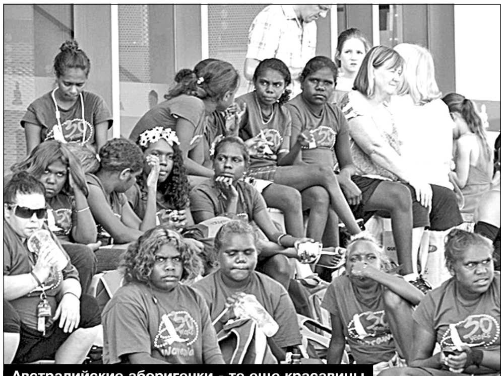
Австралийские аборигенки - те еще красавицы

Резюмею: Великая океанская дорога - это несколько сот километров, которые навсегда останутся в вашей памяти.