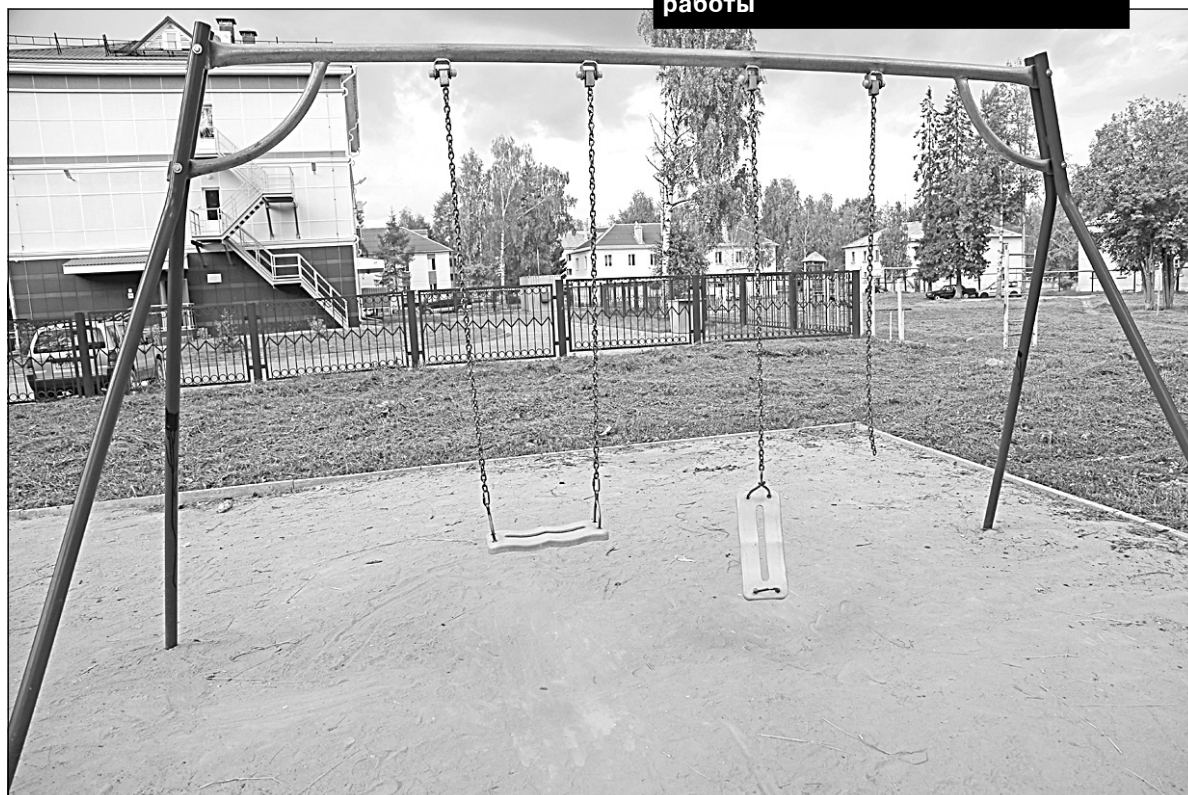
... а здесь снова нужны ремонтные работы

кова, 6 порван подвес на качелях - на них теперь невозможно кататься. На одной из верхних площадок игрового комплекса в парке им. Алпаидзе уже свинчены болты, на которых держалась защитная перекладина. Кому они помешали, неиз-