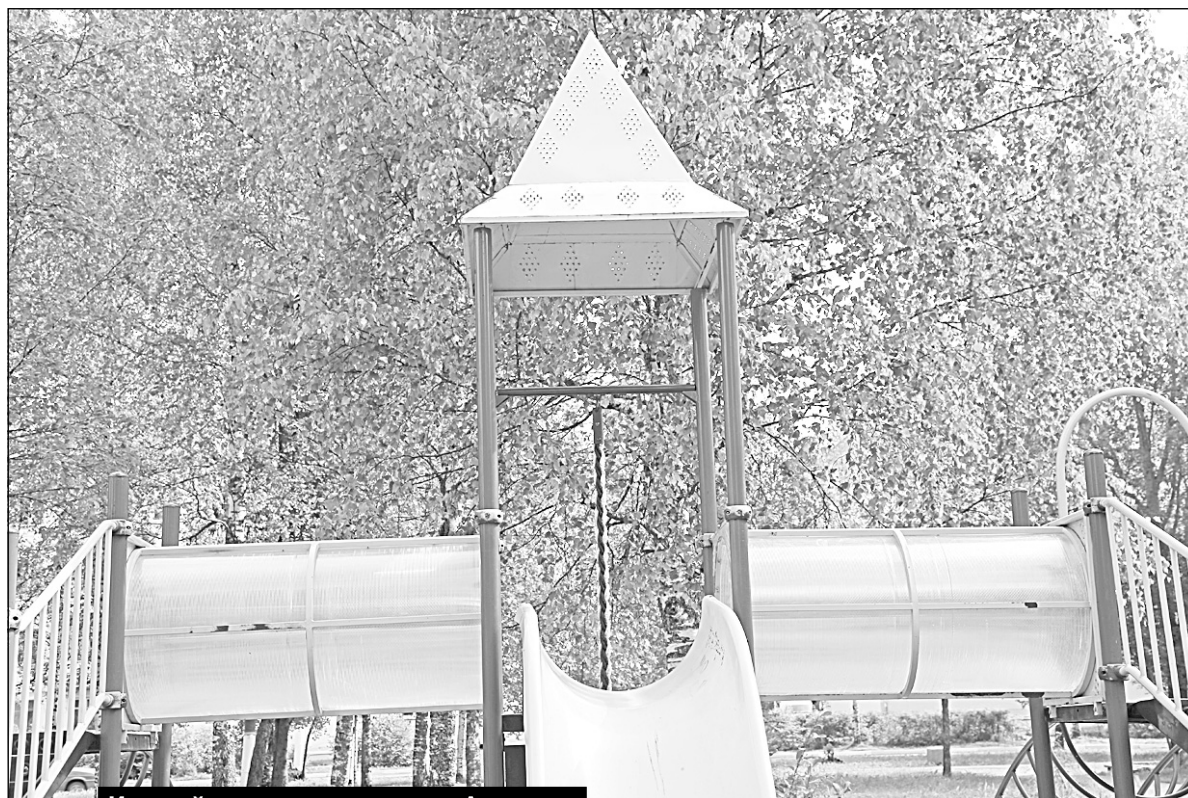
Игровой комплекс в парке им. Алпаидзе полностью отремонтирован...

Казалось бы, что еще нужно для детского досуга, как не полностью функционирующая и безопасная площадка? Но, по-видимому, не все в городе так считают, привнося частицу хаоса в городской порядок. Так, на площадках во дворе дома Ломоносова, За и Овчинни-