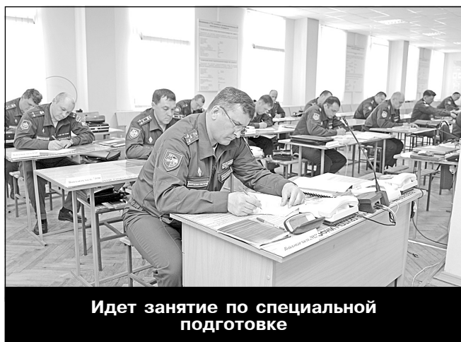
Идет занятие по специальной подготовке