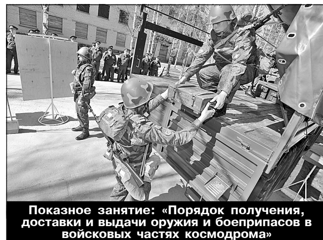
Показное занятие: «Порядок получения, доставки и выдачи оружия и боеприпасов в воинских частях космодрома»