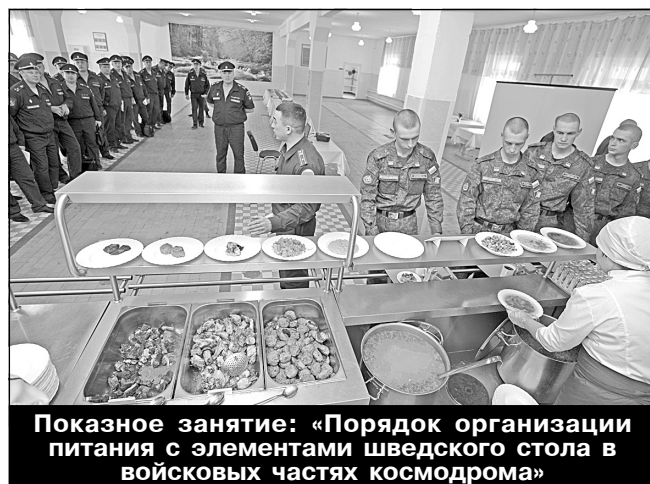
Показное занятие: «Порядок организации питания с элементами шведского стола в воинских частях космодрома»