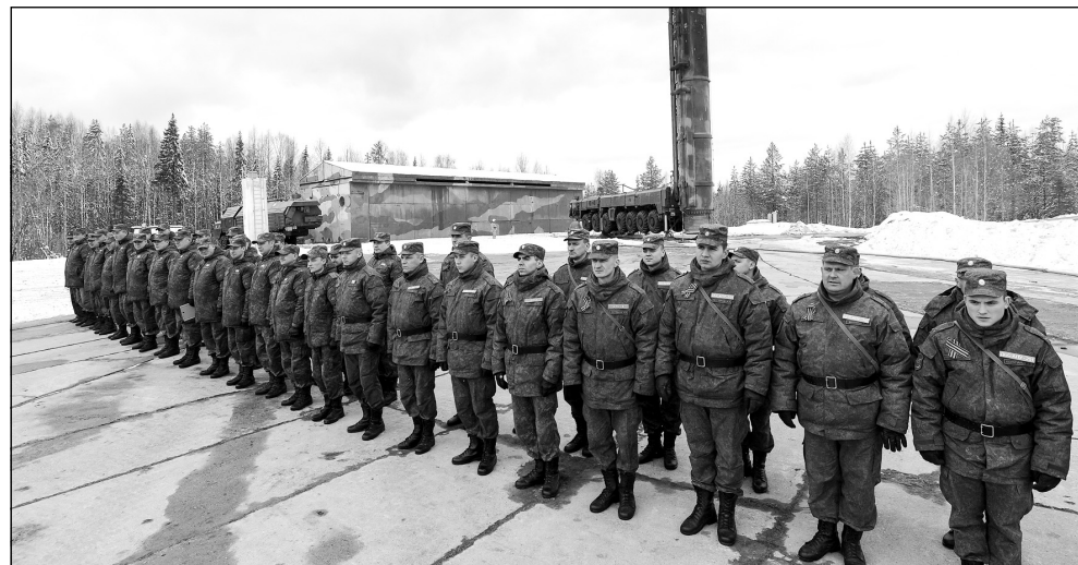
Использованы материалы, опубликованные на Интернет-сайтах: mil.ru, xvpk-news.ru Пресс-служба космодрома