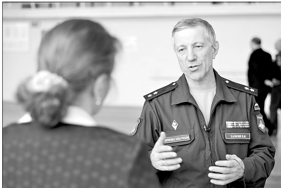
Дирижер, композитор, член Союза композиторов РФ, Заслуженный деятель искусств РФ, Заслуженный деятель Всероссийского музыкального общества, главный военный дирижер России генерал-лейтенант Халилов Валерий Михайлович

- Это плановая поездка проверки состояния военно-оркестровых служб в округах. В данном случае мы проверяем Западный военный округ. Мы оцениваем состояние, возможности и перспективы военных оркестров. Также смотрим наличие материальной базы (студии, инструменты, нотная литература...). Беседуем с командованием, определяем, какую нагрузку несут военные оркестры в плане патриотического, духовного и эстетического воспитания, какую роль играют они в организации художественной самодетельности и обеспечении музыкальных ритуалов (подъём Государственного флага, строевые смотры, поверки личного состава...). Проще сказать, выясняем профессиональный уровень подготовленности оркестров. И, конечно, если этот уровень слабават, выясняем причины, мешающие выполнению служебных задач. Только после этого мы уже ставим перед собой задачи по устранению недостатков и обязательно отмечаем в