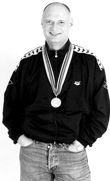
Позднее переехал в Самару, где возглавил плавательный центр. Кстати, воспитанники это-

Занимался Юрий прилежно, и вскоре пришли его первые успехи. Уже в восьмом классе он стал мастером спорта, попал в юношескую, а затем и во взрослую сборную СССР. За год до Олимпиады, в 1979 году, выиграл вместе с эстафетной командой Кубок Европы. После блистательной победы на Олимпиаде Юрий ещё достаточно долго оставался в большом спорте, но настолько громких успехов больше не добивался.