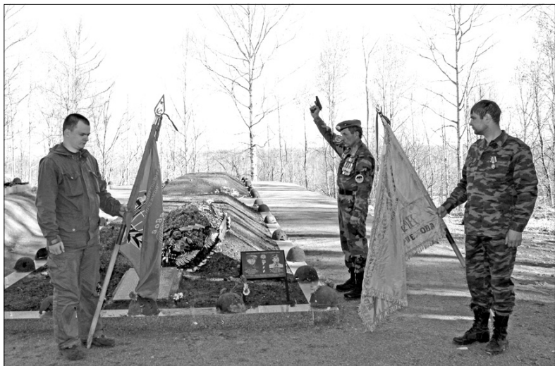
Вначале участники вахты отпраздновали в деревню Веркола в музей Федора Абрамова.

Здесь же мы посетили его могилу, а дальше поехали в музей деревни Ваймуша. Где бы мы