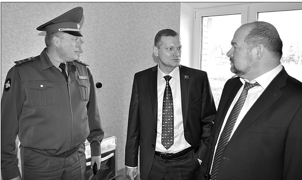
Строительные работы в доме по улице Циргвава, 4 полностью закончены, квартиры сдаются с чистовой отделкой. Распределение квартир начнется с 10 сентября