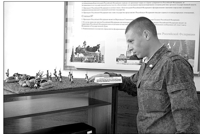
Уроки военной истории

отделения, в подчинении у меня 7 военнослужащих. Отношусь ко всем с уважением, ребят недавнего призыва "подтягиваю" по физподготовке, тем более, что и сам с удовольствием занимался и занимаюсь спортом, помогаю "новичкам" успешно влиться в наш воинский коллектив. Не буду скрывать, у всех по-разному выходит. Но в чём наши новобранцы похожи, так это в том, что с трудом привыкают к послеобеденному отдыху. Для меня же этот дневной сон в удовольствие -