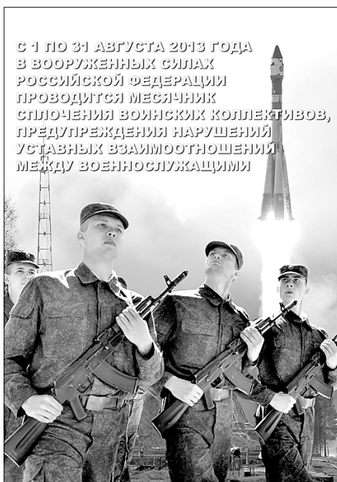
С 1 по 31 августа 2013 года в Вооруженных Силах Российской Федерации проводится месячник сплочения воинских коллективов, предупреждения нарушений уставных взаимоотношений между военнослужащими

Воинский коллектив, как впрочем и любой другой, должен быть дружным и сплоченным, чтобы отчетливо осознавать задачи, стоящие перед ним, и эффективно их выполнять. А вот что для создания такого коллектива необходимо, и как достичь наиболее максимального успеха в работе с личным составом воинских частей, помогают понять, а самое главное сделать, мероприятия Месячника сплочения воинских коллективов, предупреждения нарушений уставных правил взаимоотношений между военнослужащими в воинских частях 1 ГИК МО РФ