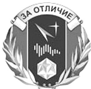
Знак главы Мирного «За отличие», в народе – значок