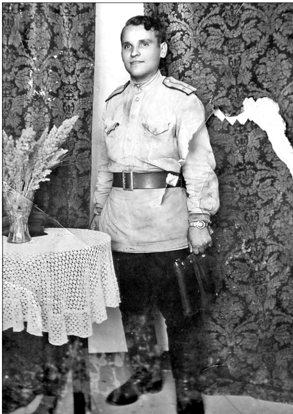
На фото: муж Валентины Гавриловны