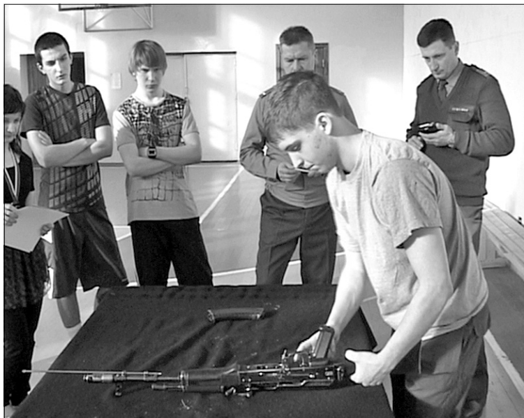
Данное мероприятие организуется в Мирном ежегодно с целью формирования у подростков качеств, необходимых

Старшеклассники городских общеобразовательных учреждений приняли участие в спартакиаде допризывной молодежи. Она проводилась в течение трех дней в школе №3 и на центральном стадионе. Одиннадцатиклассники соревновались в меткости, скорости, силе и умении обращаться с оружием