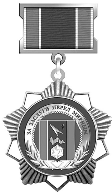
Почетный нагрудный знак «За заслуги перед Мирным» – вторая после «Почетного гражданина» муниципальная награда, в народе – орден

К 8 Марта более 150 женщин Мирного получили поощрения из рук градоначальника Юрия Сергеева – нагрудный знак «За отличие» (в народе «значок»), почетную грамоту главы Мирного (либо как дополнение к знаку, либо как отдельный вид поощрения) и благодарность главы города. В то же время 21 представительница прекрасного пола получила к празднику одну из муниципальных наград – почетный нагрудный знак «За заслуги перед Мирным» (в народе «орден»), нагрудный знак «За вклад в развитие Мирного» («медаль») или почетную грамоту городского Совета депутатов