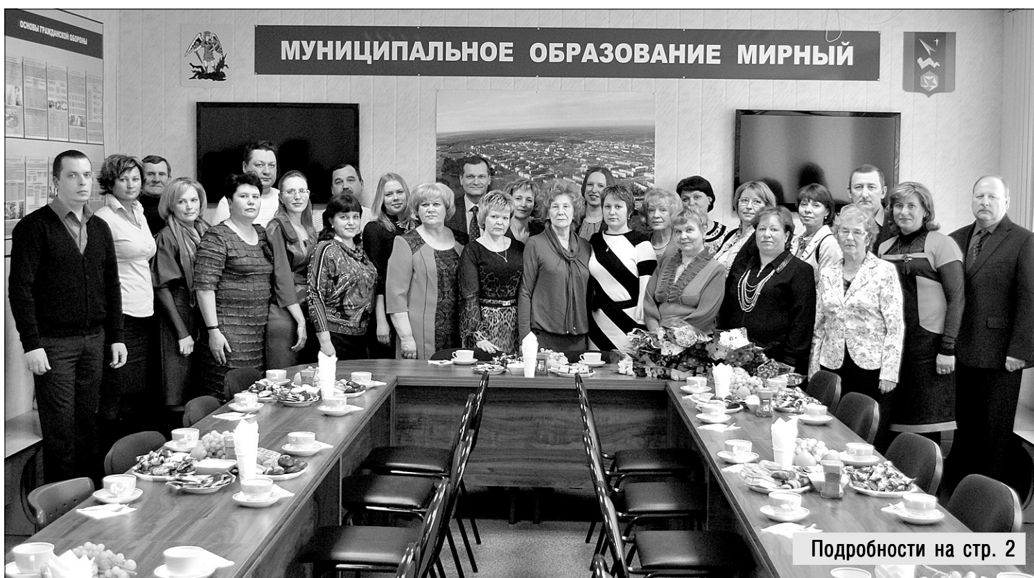
Подробности на стр. 2

К 8 Марта более 150 женщин Мирного получили поощрения от главы города Юрия Сергеева