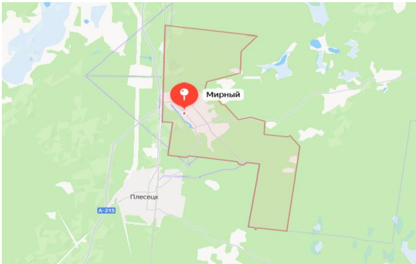
Рисунок 1 - Расположение границ городского округа Мирный

Территория вытянута с востока на запад и составляет примерно 50 километров (31 миль) в длину и 20 километров (12 миль) в ширину. Сам город расположен в крайней юго-западной части этой территории. Река Емца протекает на севере региона, а река Мехренга пересекает его с юга на север в восточной части. Вся территория относится к бассейну Северной Двины. За исключением военных объектов, она покрыта хвойными лесами (тайгой).