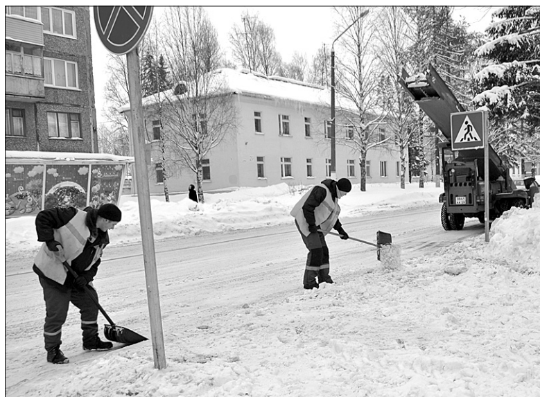
На фото: но человеческие руки тоже ничем не заменишь...