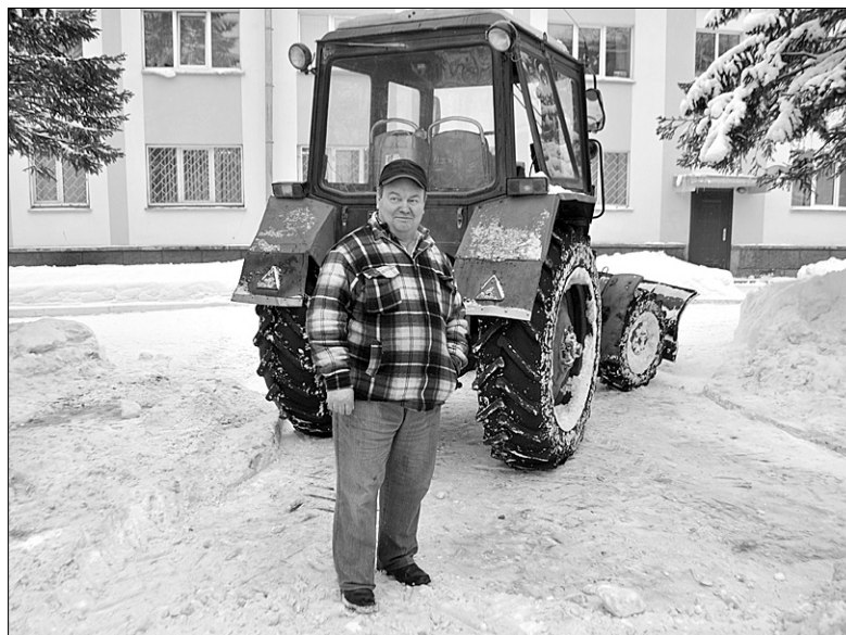
На фото: небольшой отдых – и снова за работу