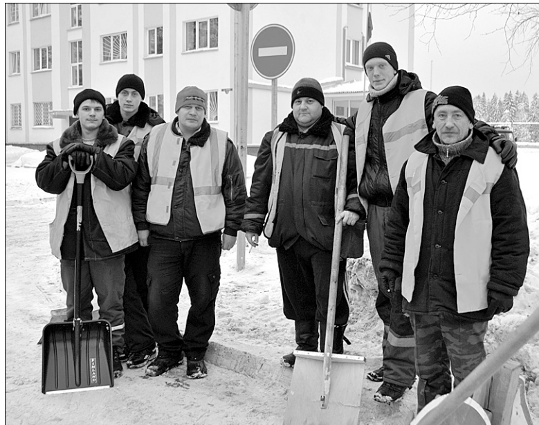
На фото: один в поле не воин, а шестеро – это уже команда!