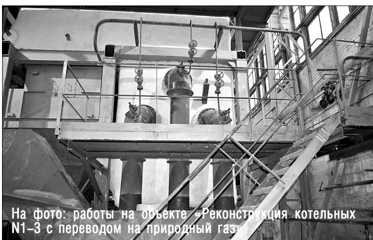
На фото: работы на объекте «Реконструкция котельных N1-3 с переводом на природный газ»