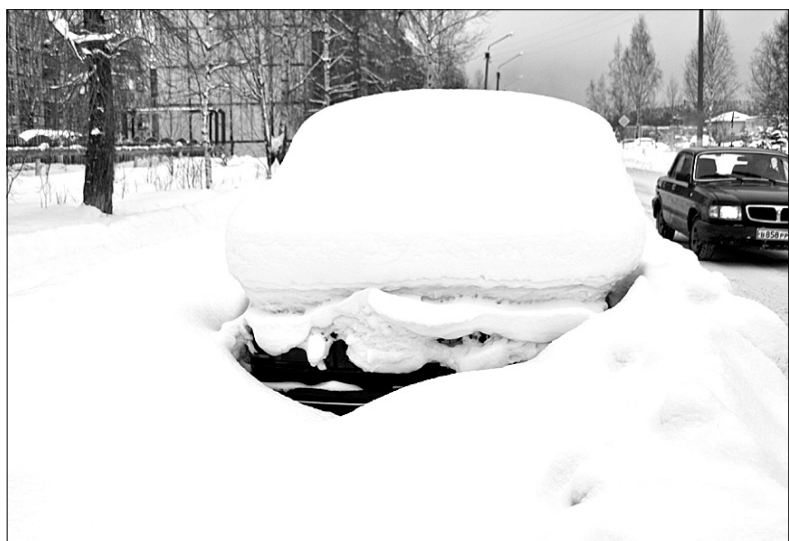
На фото: авто на «зимовке» – извечная проблема дорожных служб