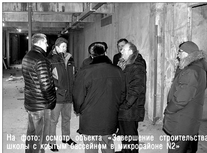
На фото: осмотр объекта «Завершение строительства школы с крытым бассейном в микрорайоне N2»