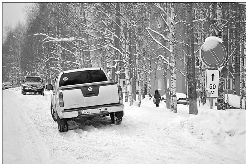
На фото: некоторым и запрещающие знаки до «лампочки»