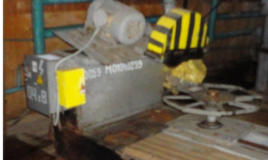
станок торцовочный с поворотом пилы ЦТ 10-5: