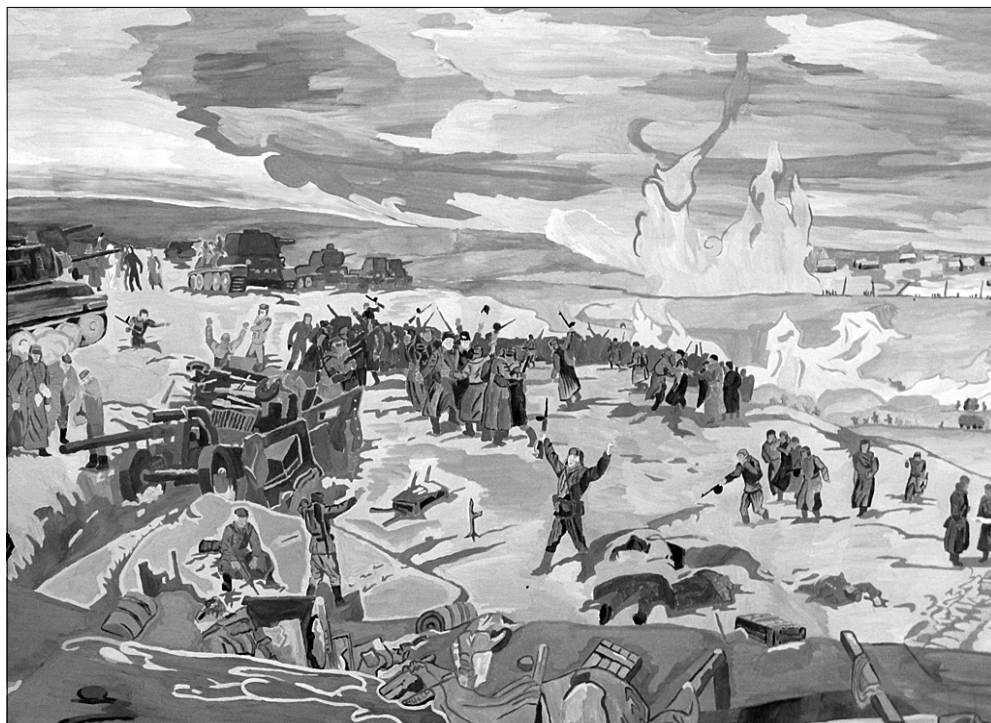
Работы военнослужащих войсковой части 42651, занявшие призовые места