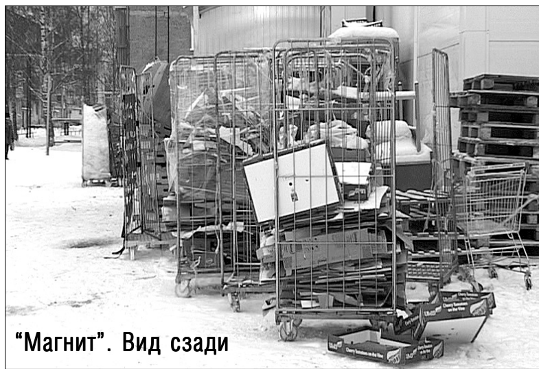
«Магнит». Вид сзади

геева список всех этих проблем и «говорящие» о них фотографии были направлены руководству местного гипермаркета и в головное предприятие – ЗАО «Тандер». В ответном письме администрации Мирного заверили, что все недостатки будут устранены.