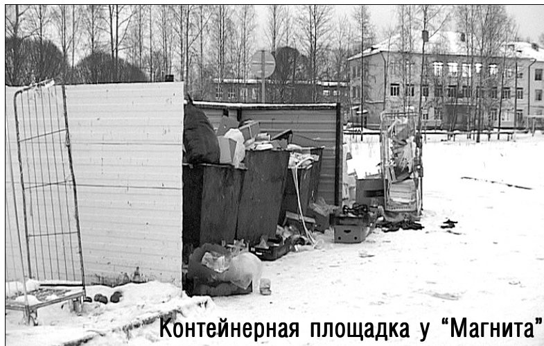
Контейнерная площадка у «Магнита»