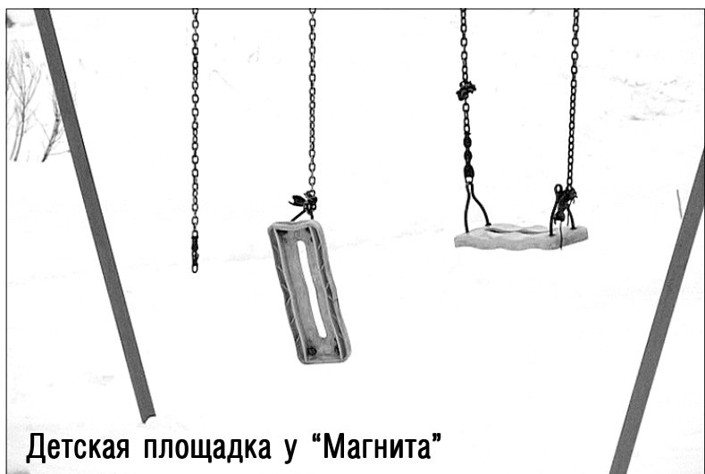
Детская площадка у «Магнита»