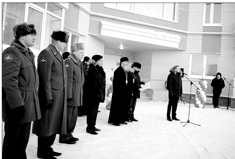
Многие супружеские пары не стали скрывать, что получив такое жильё, теперь можно подумать и о прибавлении в семействе.

Да, теперь военнослужащим войсковой части 12403, дислоцирующейся в заполярном городе Нарьян-Мар, будет проще обратиться за помощью в решении разных бытовых вопросов к своим соседям по дому. Даже соль попросить не вызовет труда. А все почему? Да потому, что практически все, кто служит в этой воинской части, стали новосёлами и жителями одного дома