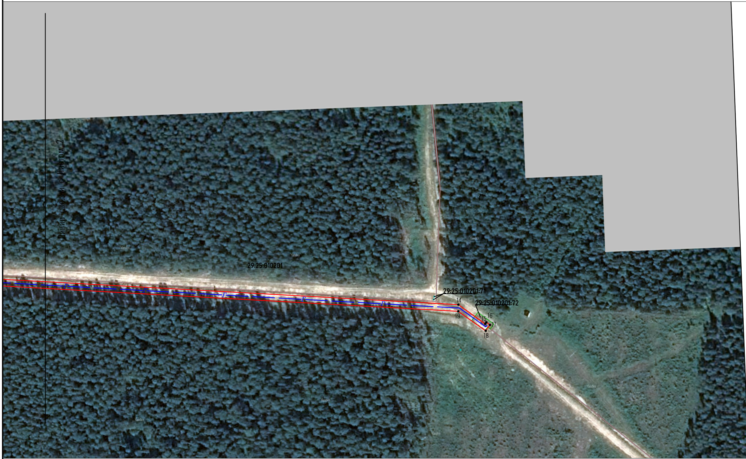
Схема расположения границ публичного сервитута.