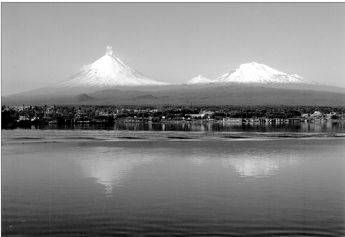
И как не влюбиться в такую красоту!

на себе ощущаю. Я приехал на космодром для подтверждения своей классной квалификации. Сажу перед комиссией Войск ВКО, мыслями собираюсь с ответами, а глаза просто закрываются: ведь несмотря на то, что здесь разгар рабочего дня, у нас на полуострове дело близится уже к глубокой ночи.