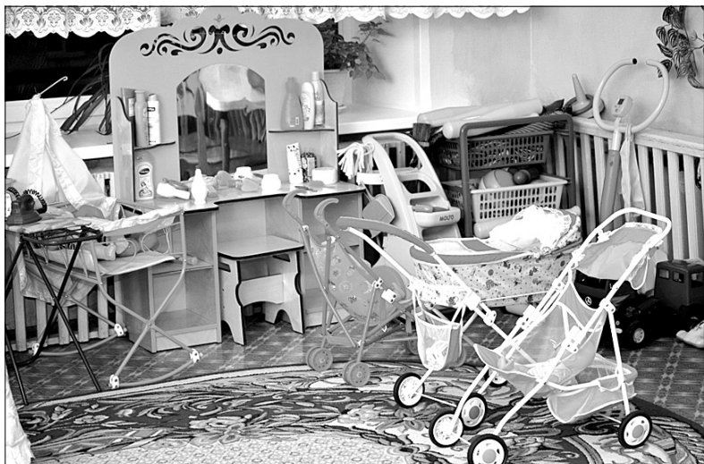
В игре детей есть часто смысл глубокий (И.Ф. Шиллер)

Школа № 1 – ремонт фойе и актового зала по предписаниям пожарного надзора. Стены этих