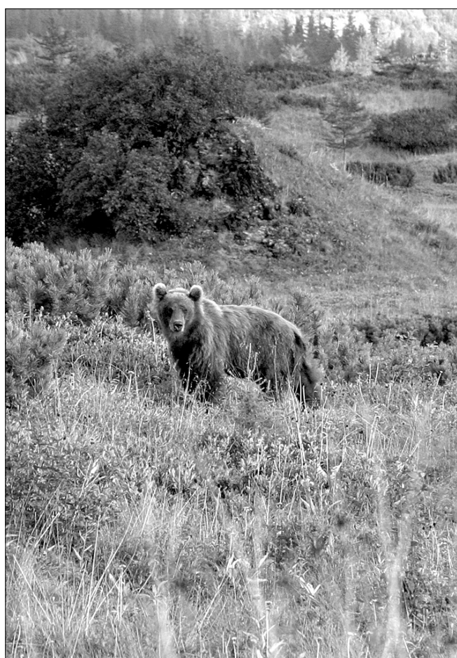
Во время прогулок на природе можно встретить и такого косолапого местного жителя, который не прочь и попозировать перед камерой

- В детстве не ощущал никакой разницы. И дома хорошо, и у бабушки в Краснодарском крае прекрасно себя чувствовал. А вот сейчас разницу во времени очень даже