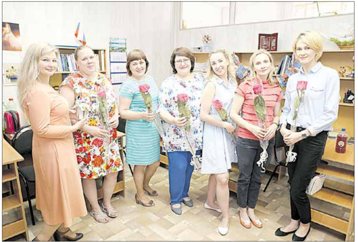
15-летний юбилей МТК