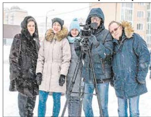
На зимних съемках