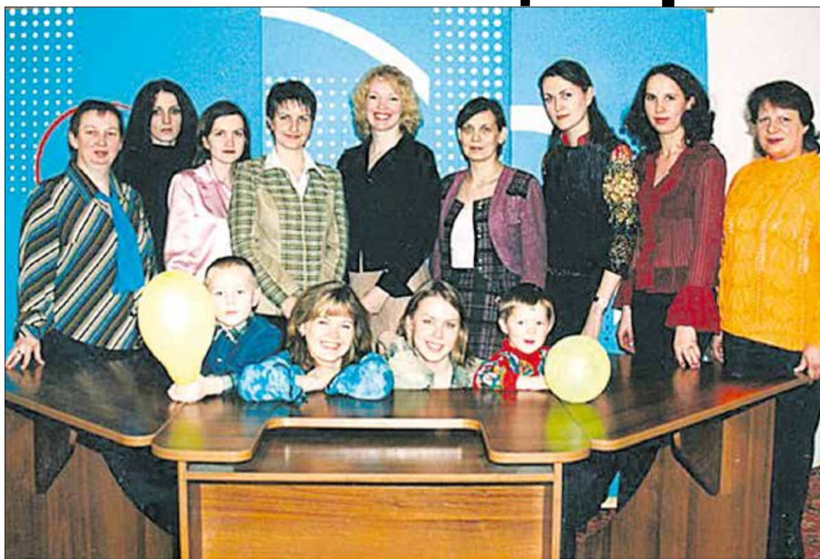
Коллектив МТК в первые годы работы

– В первые годы мы готовые программы перед выпуском отсматривали в монтажной всем коллективом.