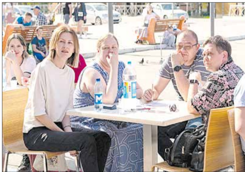
Команда МТК на интеллектуальной игре, 2022 год