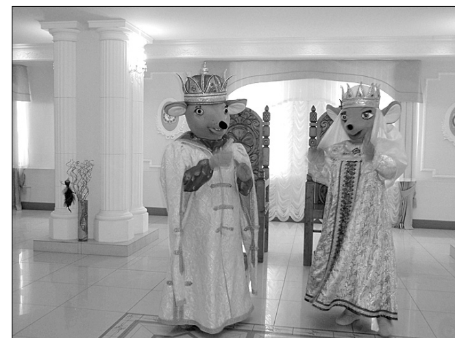
Царь и царица города Мышкина