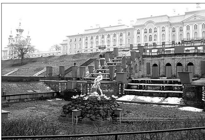
Летний дворец красив и зимой

Со 2 по 8 января 2013 года - "Новогодний фейерверк в Санкт-Петербурге". Стоимость тура для школьника - 9300-10200 рублей, для взрослого - 9800-10700 рублей.