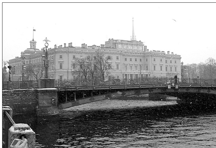
Прекрасный город на Неве

С 3 по 6 января 2013 года - "В Москву на Кремлёвскую ёлку". Стоимость тура для школьника - 7200 рублей, для взрослого - 6450 рублей.