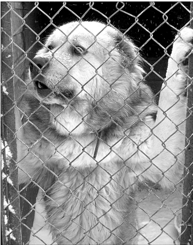
Самый громкоголосый, но очень серьезный и уравновешанный кавказец Гром