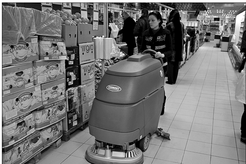
Поломояная машина – достижение цивилизации!

не пропустила. Ведь когда люди не выезжая из своего населенного пункта имеют возможность приобрести все необходимое для жизни – в этом и проявляется забота