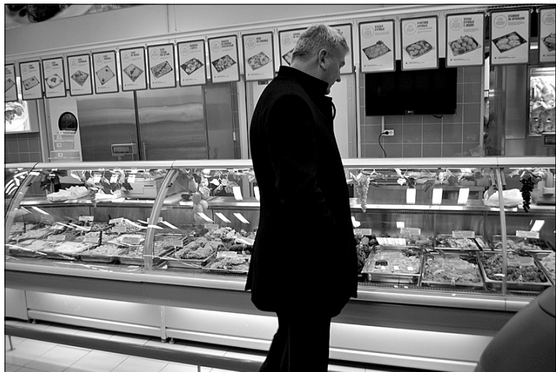
Чего бы купить на обед?..

Руководству города миряне не раз жаловались и на длинные очереди к кассам,