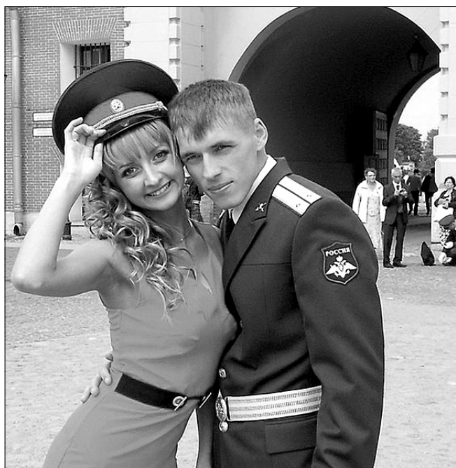
Почему один? Нас двое!