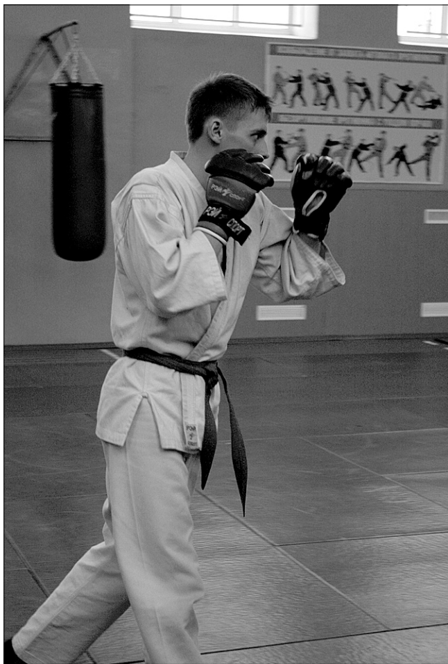
Мастер на все руки

- Конечно, практика и теория - две разные вещи. В теории я подкован, а сейчас все свои знания применяю на практике. Тяжело, но думаю, что получается. Провожу занятия по физической подготовке как с офицерами, так и с военнослужащими по призыву. Стараюсь найти индивидуальный подход к каждому. Думаю, что моя часть сможет достойно пройти грядущую проверку. Могу похвастаться, что за месяц работы уже ощущаются улучшения результатов в силовых упражнениях, кроме того, у меня получилось сплотить, пусть пока ещё небольшую, группу офицеров - любителей лёгкой атлетики.