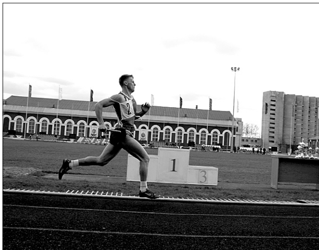
Пусть на груди лишь цифра 2, но буду первым я всегда!

сглазить, люблю быть победителем, даже в своих мечтах.