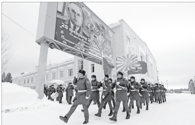
ветского Союза генерал-лейтенанта Штанько С.Ф.

После торжественного возложения цветов к бюсту героя все присутствующие на церемонии были приглашены на военно-исторические чтения, посвященные столетию со Дня рождения Героя Со-