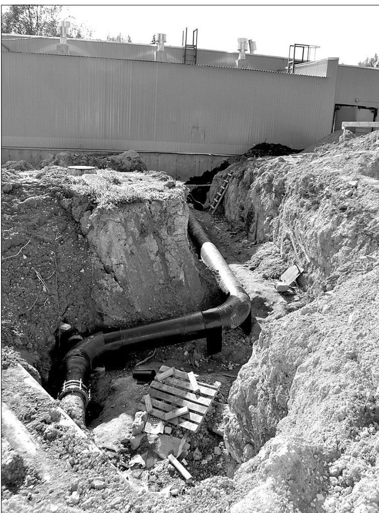
Водозабор «Южный» надо срочно заканчивать