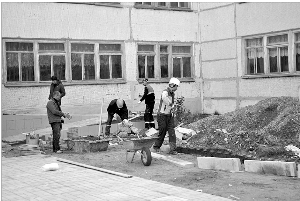
1 сентября во дворе 4-й школы должно быть красиво!