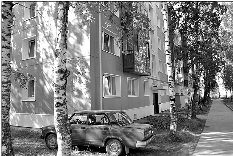
Жильцы домов, где реставрировали фасады, больше не жалуются на беспорядок