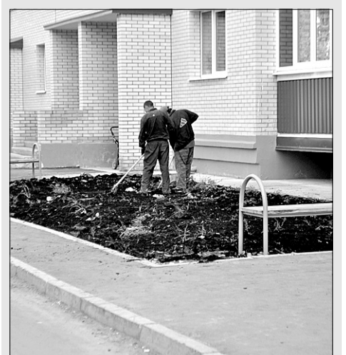
У дома N 6 по ул. Циргвава подрядчик наконец-то занялся благоустройством