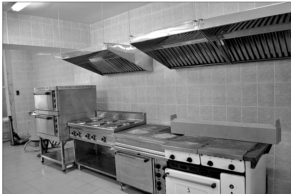
В детском саду № 4 пищеблок сверкает новизной