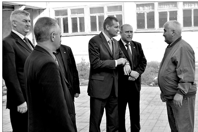
Время «Ч», дорогой, ремонт пора заканчивать!

В момент проверки на объектах садика не было ни