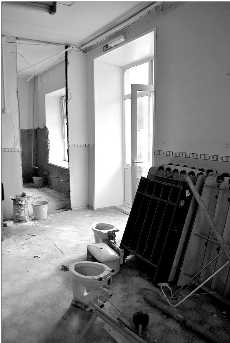
Зато второму саду конец ремонта пока только снится