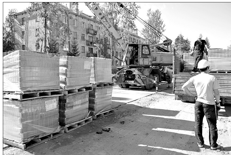
Подготовка к укладке тротуарной плитки на улице Неделина