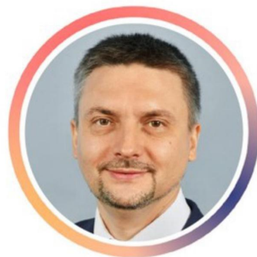
Станислав Казарин Вице-губернатор Санкт-Петербурга