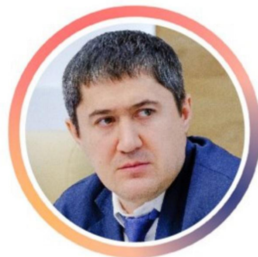
Дмитрий Махонин Глава Пермского края