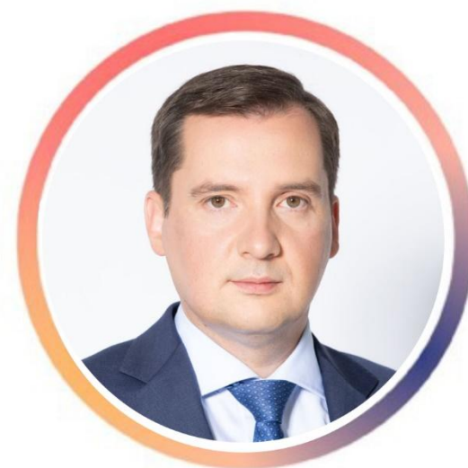
Александр Цыбульский Губернатор Архангельской Области