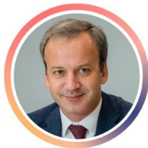
Аркадий Дворкович Председатель, Фонд «Сколково»