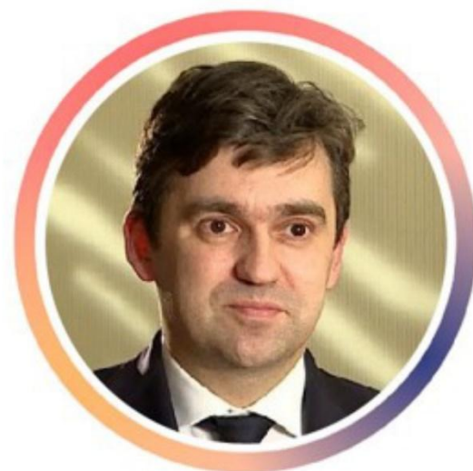
Станислав Воскресенский Губернатор Ивановской области