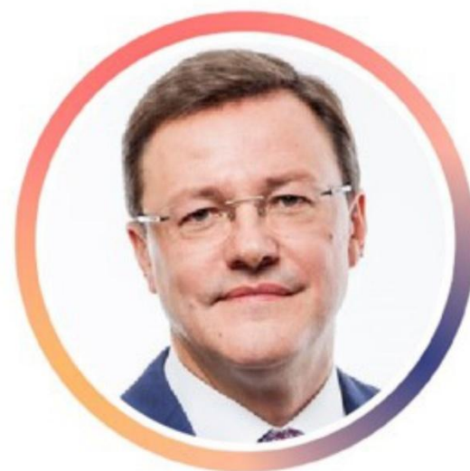
Дмитрий Азаров Губернатор Самарской области