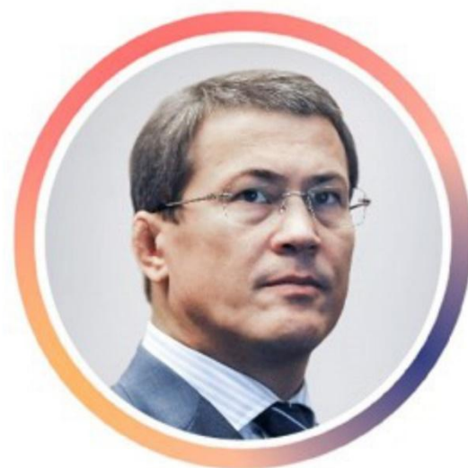
Радий Хабиров Глава, Республика Башкортостан