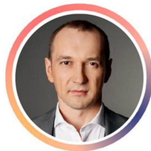
Олег Теплов Генеральный директор, VEB Ventures