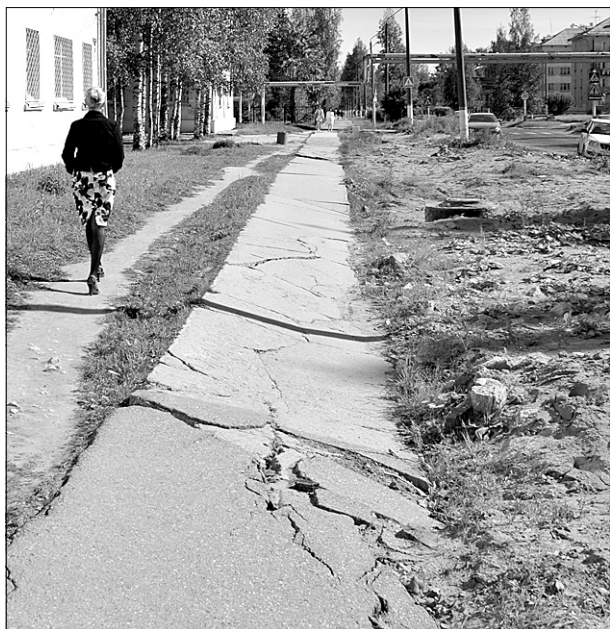
Действительно, лучше не рисковать и обойти кособок тротуар на ул. Овчинникова по тропинке

- Как только на ул. Неделина была проложена ливневая канализация, мы приступили к устройству так называемой дорожной одежды. Асфальтирование здесь будет производиться по существующим железобетонным плитам, поэтому старый асфальт был срезан фрезой. Так как проектом предусмотрены стояночные площадки – так называемые уширения дороги, – прежде чем укладывать асфальт, нужно сначала устроить их. Уширения идут у нас по всей