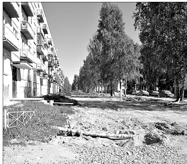
Верните асфальт на улицу Мира!

- Как я уже сказал, сейчас разрабатывается проект реконструкции автомобильных дорог второй очереди. Остальные ули-