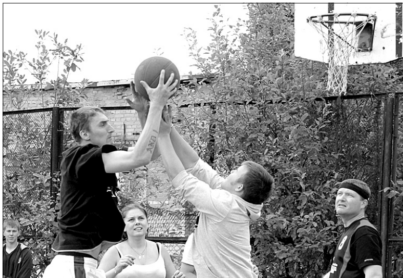
... и в нападении