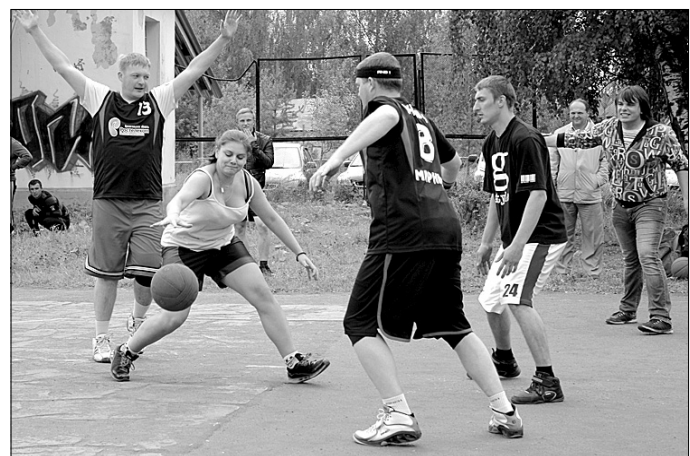
Та самая Маша, украшение этих соревнований