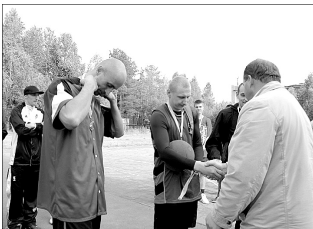
Скромные Крутые бобры – 1 место