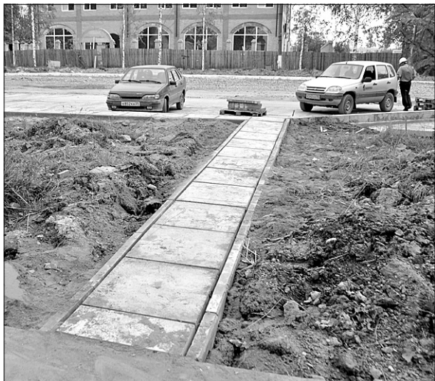
Со стоянок для водителей и пассажиров автомобилей предусмотрены выходы на тротуар

Во-вторых, прокладывая «ливневку», мы часто сталкивались с сетями, не указанными ни на каких планах. О них не знал водоканал, они не были указаны в проекте, отсут-