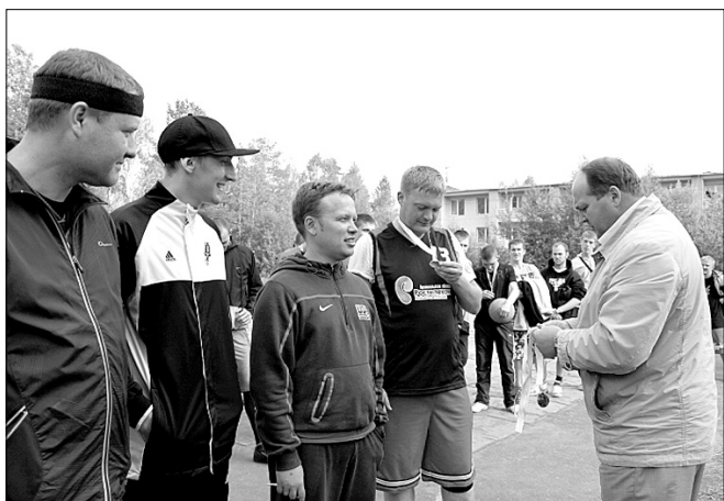
Школа, хотя и «старая», но порох еще есть – 2 место