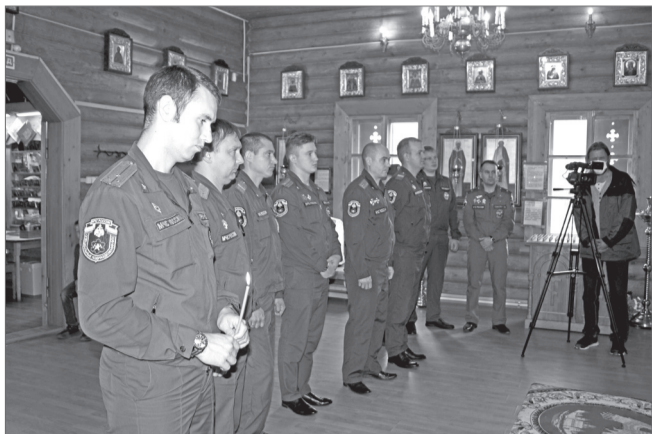
17 сентября по всей стране в православных храмах прошел благодарственный молебен в честь иконы Божьей Матери «Неопалимая Купина».