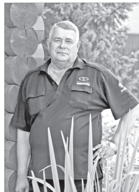
ной деятельности! Счастья и благополучия Вам и Вашим близким!

Крепкого Вам здоровья, оптимизма и новых успехов в Вашей ответствен-