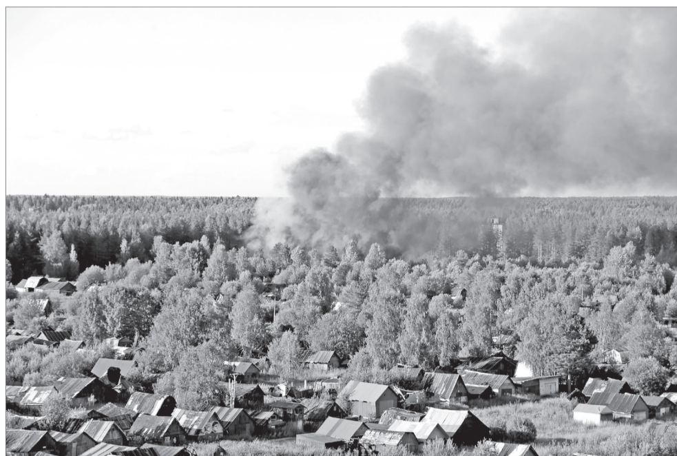
России по Архангельской области (п.Плесецк); пожарной части № 58 (п. Савинский).

Создавшаяся ситуация потребовала привлечения дополнительных сил. Всего при тушении пожара было задействовано 45 человек личного состава и 10 единиц специальной пожарной техники СПСЧ № 4 ФГКУ «Специальное управление ФПС № 18 МЧС России», Мирнинской ПАСС, пожарных команд Министерства обороны, пожарной части № 46 ГУ МЧС