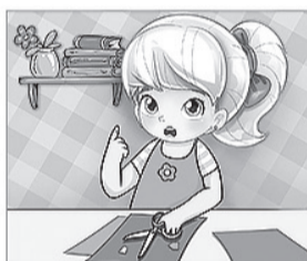
НЕ ИГРАЙ с колющими и режущими предметами