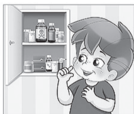
НЕ ПРОБУЙ на вкус лекарства