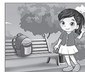
НЕ ТРОГАЙ чужие вещи