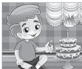
НЕ ИГРАЙ с огнём