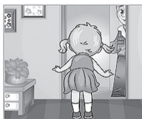
НЕ ОТКРЫВАЙ дверь незнакомым людям