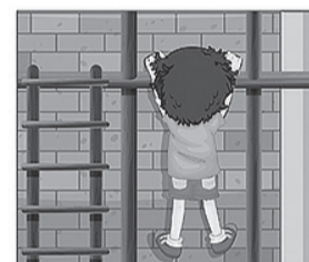
НЕ ИГРАЙ на стройке