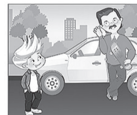
НЕ РАЗГОВАРИВАЙ с незнакомыми людьми