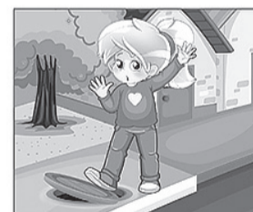
НЕ НАСТУПАЙ на люки