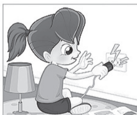
НЕ ТРОГАЙ электроприборы