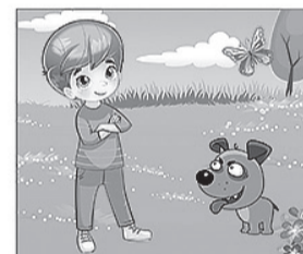
НЕ ДРАЗНИ собак