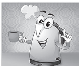
НЕ ИГРАЙ с горячим