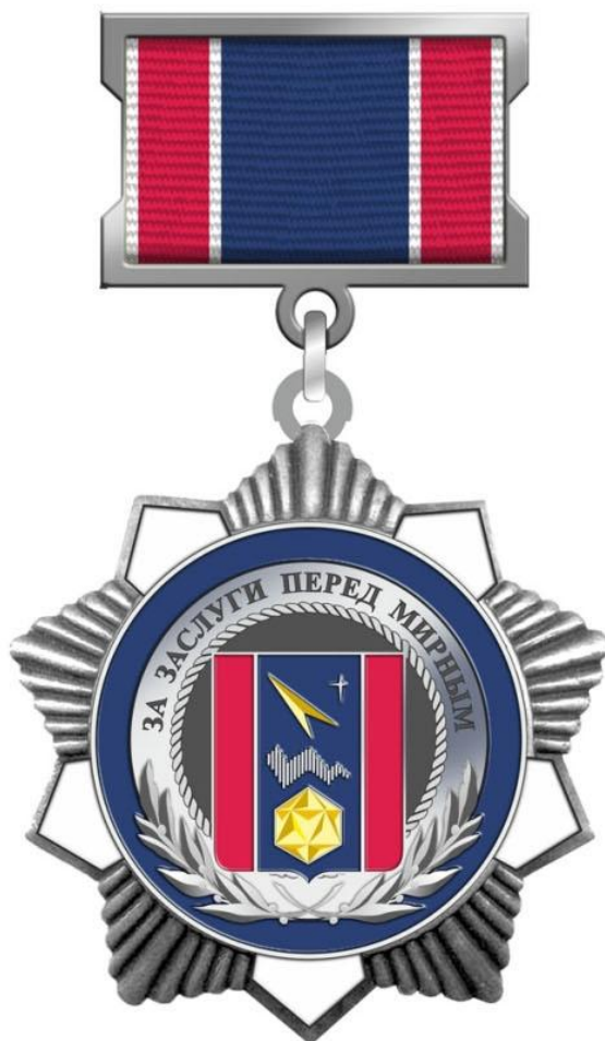
Рисунок Почетного нагрудного знака «За заслуги перед Мирным»