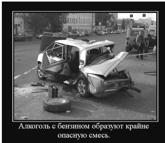
Алкоголь с бензином образуют крайне опасную смесь.