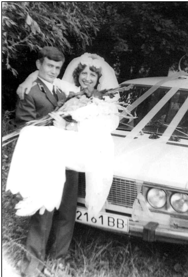
Любимая «ноша» не тянет

Закончил я училище в 1983 году. И опять передо мной выбор встал: продолжить военную службу в Белоруссии, Украине или на полигоне "Плесецк". Честно скажу, что север сначала даже не рассматривал. Но, сами знаете, мир не без добрых людей. Так, один из моих преподавателей стал мне о прелестях военной службы на северной земле рассказывать. Я подумал, взвесил все "за" и "против", посоветовался с супругой и принял решение отправиться на север. И вот, по сей день я покорный слуга Учебного центра, и, более того, никогда об этом не пожалел.