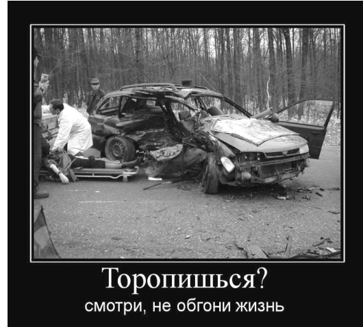
Торописься? смотри, не обгони жизнь