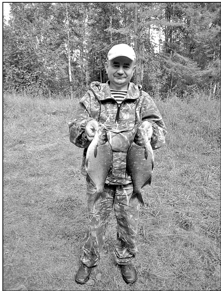
Хороша рыбка!!! Сам поймал!

Предназначался ДУБО для поддержания ракетного вооружения, средств боевого управления и связи в готовности для обеспечения учебного процесса личного состава ракетных полков, прибывших для переподготовки на новые типы ракетных комплексов. Но на