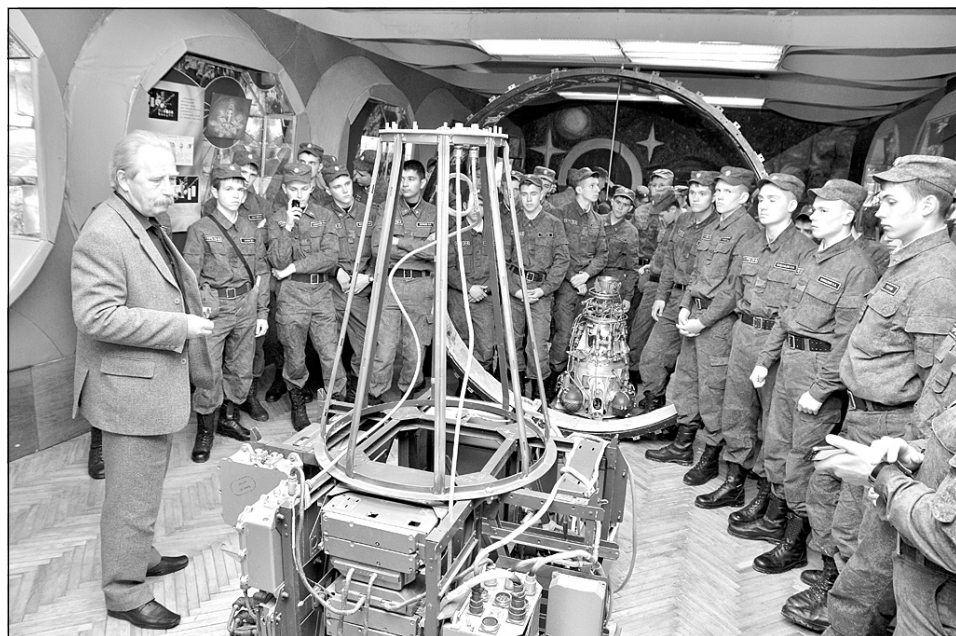
Интереснейший музейный экспонат!

Спросила я у ребят: как сейчас складываются их отношения с бывшими однокурсниками? Кадеты "не по-