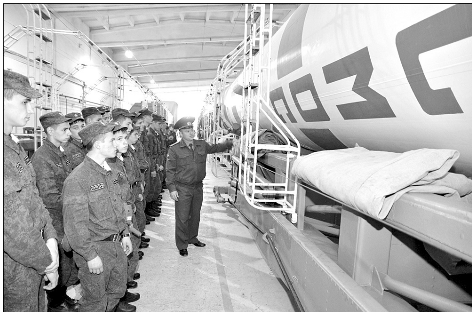
Ничего себе, какая громадина!

было. Командование космодрома позаботилось о насыщенности и разнообразии программы пребывания кадетов, охватившей все стороны деятельности 1ГИК МО. Помимо того, что юные защитники Отечества узнали о работе, истории и традициях космодрома, его воинских частей, почтили память погибших испытателей ракетно-космической техники на мемориале "Вечный огонь", ребята с интересом посетили спортивный комплекс "Звезда", познакомились с нашим городом и побывали на множестве других, не менее интересных и познавательных мероприятиях. Ну а что им больше всего понравилось и запомнилось, а также определились ли они с выбором дальнейшей профессии, я узнала непосредственно от самих кадетов.