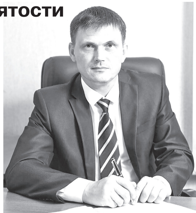
Все справки касаясь данного направления нашей работы можно получить по телефону 8(81832) 7-17-14.

В настоящее время у нас заключены восемь соглашений с работодателями Плесецкого района и Мирного, в рамках которых работают более ста пятидесяти человек.