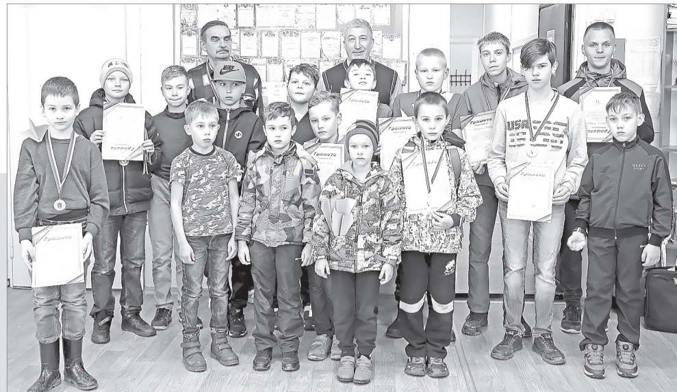
Пресс-служба главы Мирного по информации отдела по управлению социальной сферой