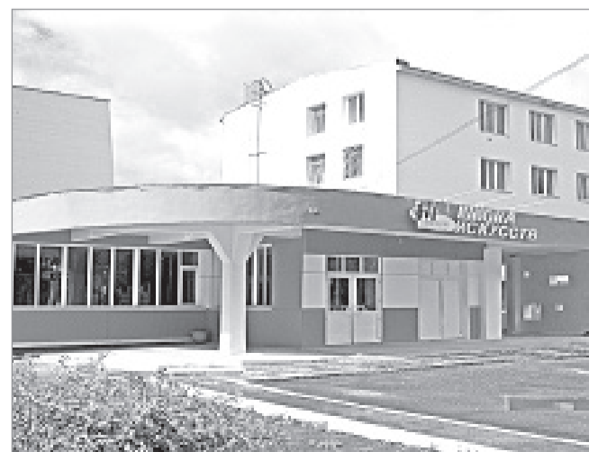
Мирнинская территориальная избирательная комиссия

Понедельник – пятница – 15:00 - 19:00. Суббота – воскресенье – 10:00 - 14:00.