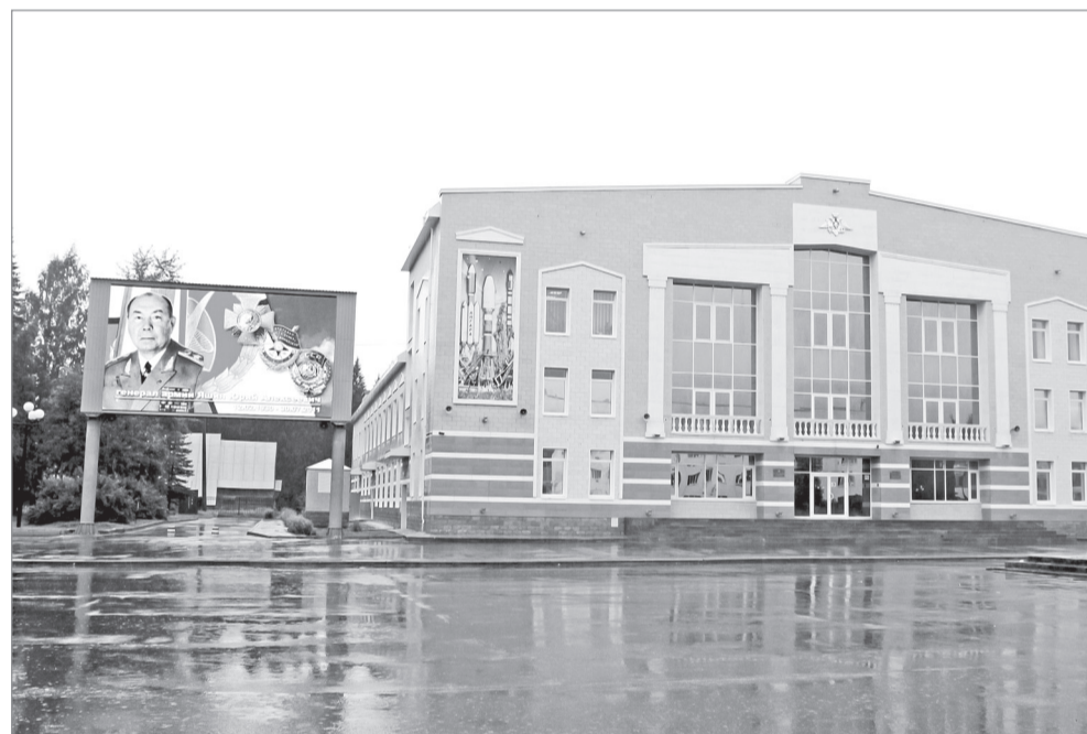
Пресс-служба космодрома Фото Виктора АНТОНОВА