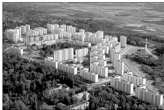
Микрорайон Осиновая роща (г. Санкт-Петербург)