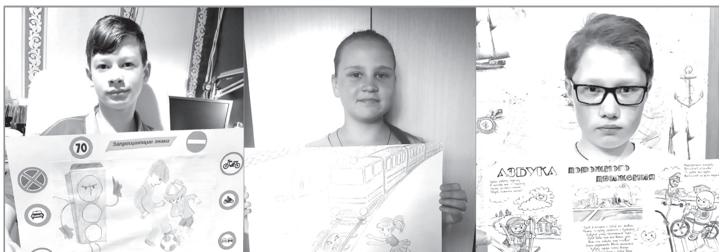
Отдел ФГПН ФГКУ «Специальное управление ФПС № 18 МЧС России»

Сотрудники пожарной части от всего сердца поздравляют родителей и детей с праздником и дают наставление: «Правила пожарные соблюдай, в случае беды сразу пожарных вызывай! С мобильного - 101, с городского - 01».