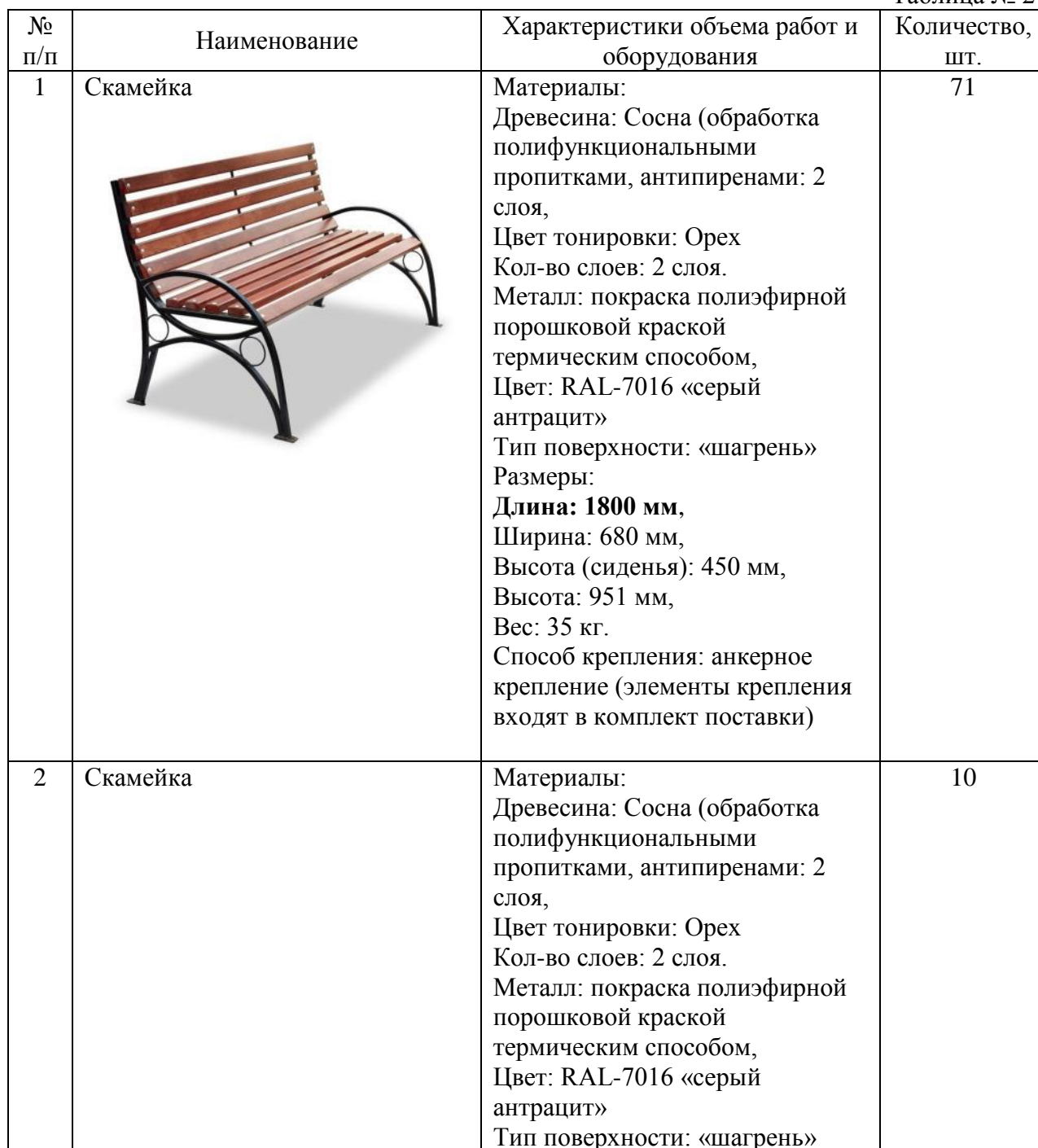
Таблица № 2

5.11. Количество малых архитектурных форм и их характеристика представлены в таблице № 2.